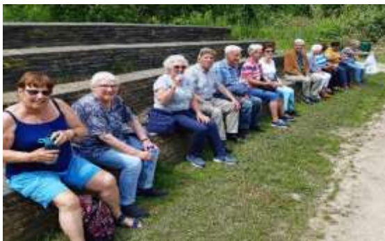
Wandelen in Delftse Hout / Bieslandse bos - Amfitheater